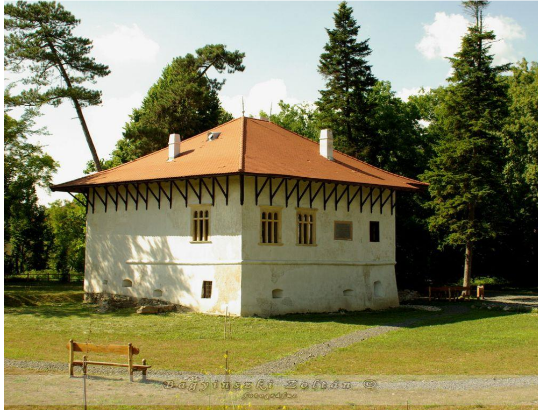
Bethlen Gábor Szülőháza.

Népesége: 1622 fő amit a 2011-ben tartott népszámlálás során Dévatól 21 km-re északnyugatra, a Maros jobb partján fekszik. A község 91,38 km 2 -es teljes területének 37%-a erdő, 29%-a szántó, 20%-a legelő és 7%-a rét