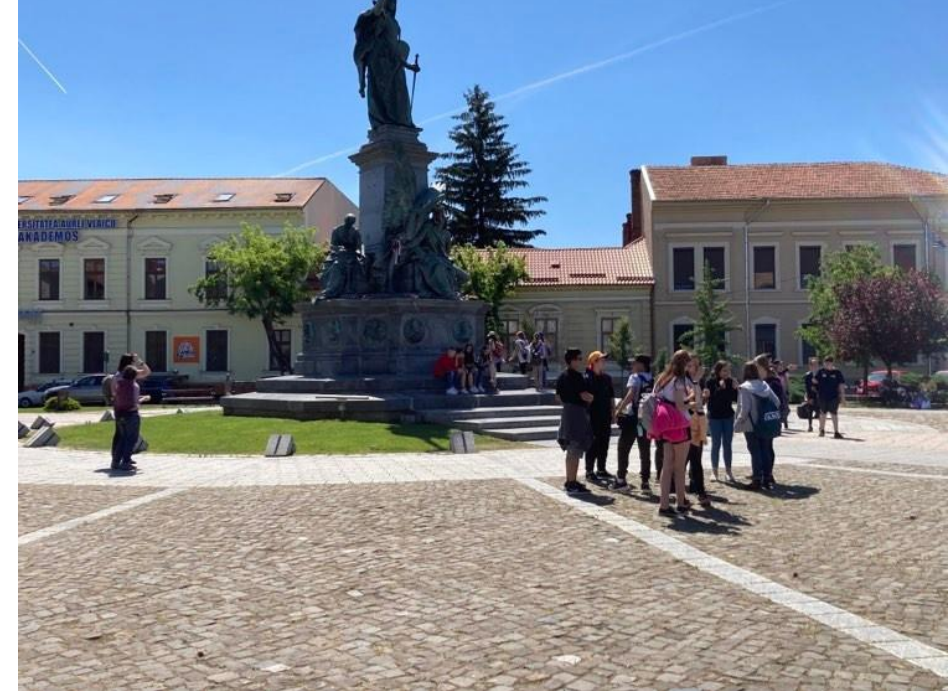
Pár csoport kép