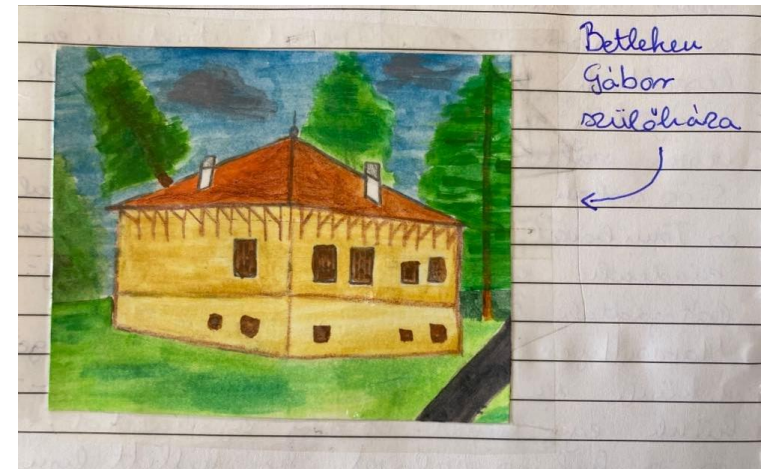
Nemszilay Diána illusztrációja